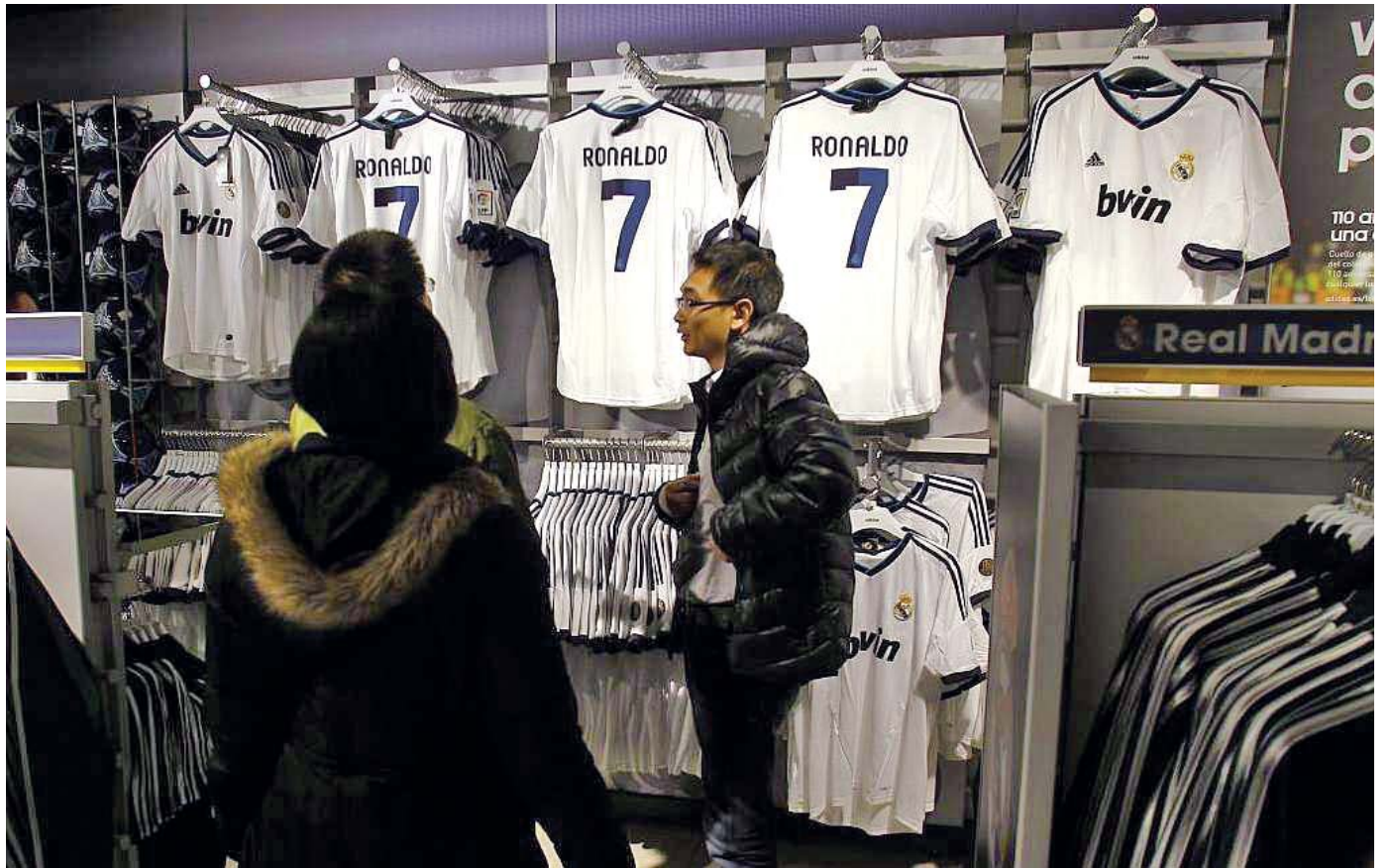
ရီးယဲလ်မက်ဒရစ်အသင်း တိုက်စစ်မှူးစီရော်နယ်ဒို၏ ဂျာစီအင်္ကျီများရောင်းချနေမှုကို အရောင်းဆိုင်တစ်ခု၌ ယမန်နှစ်က တွေ့ရစဉ်

■ အောင်သုတ ဘာသာပြန်သည်၊ ရည်ညွှန်း-ဒီအန်အေ