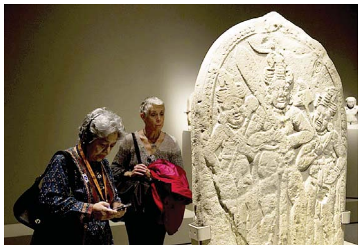
မြန်မာပြည်မှပြသမည့် ရှေးဟောင်းကျောက်ဆစ်ရုပ်တစ်ခုအား ကြည့်ရှုနေသည့် သတင်းထောက်များကို တွေ့ရစဉ်။

ယင်းပြပွဲတွင် ခင်းကျင်းပြသနိုင်မည့် မြန်မာနိုင်ငံ၏ အမျိုးသားယဉ်ကျေးမှုအမွေအနှစ်ပစ္စည်းများကို မြန်မာအစိုးရအနေဖြင့် ပထမဆုံးအကြိမ်အဖြစ် ငှားရမ်းရန် သဘောတူလက်မှတ်ရေးထိုးခြင်းကို ဂုဏ်ယူမိသည်ဟု ၎င်းကပြောသည်။ နယူးယောက်မြို့၏ မြို့တော်အနုပညာပြတိုက် (The Metropolitan Museum of Art) ၌ ဟိန္ဒူ-ဗုဒ္ဓ ကြေးရုပ်တုနှင့် မြေစေးကြေးရုပ်ပေါင်း ၁၆၀ ကို ပြသနိုင်ရန်အတွက် ငါးနှစ်ကြာပြင်ဆင်ခဲ့ရခြင်းဖြစ်သည်။ ယင်းရုပ်တုပေါင်း ၁၆၀ အနက် ၂၂ မျိုးသည် မြန်မာနိုင်ငံမှ ငှားရမ်းထားသည့် ရှေးဟောင်းပစ္စည်းများဖြစ်ပြီး တခြားရုပ်တုများသည် ကမ္ဘောဒီးယား၊ မလေးရှား၊ ထိုင်း၊ ဗီယက်နမ်၊ ဗြိတိန်၊ ပြင်သစ်နှင့် အမေရိကန်နိုင်ငံတို့မှဖြစ်သည်။ “ငါးရာစုမှ ရှစ်ရာစုကြားကာလအတွင်းမှ