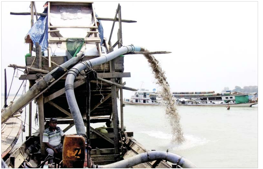
မုံရွာမြို့အနီး ချင်းတွင်းမြစ်ကြောင်းတစ်နေရာတွင် သဲသောင်ခုံးတူးဖော်နေသည်ကို ဧပြီရက်ကတွေ့ရစဉ်။

အချိန်ထိ ရေယာဉ်ပြေးဆွဲခွင့်များ ခေတ္တ ရပ်ဆိုင်းထားရကြောင်း ပုဂ္ဂလိက ရေ ယာဉ်များ စနစ်တကျပြေးဆွဲရေး ကော် မတီအဖွဲ့ဥက္ကဋ္ဌက ပြောသည်။