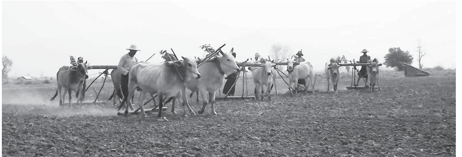
သိမ်းဆည်းခံယာမြေဧက ၉၀ ကျော်တွင် ဒေသခံတောင်သူ ၄၀ ကျော်က ဧပြီလ ၈ ရက်တွင် ထွန်တုံးတိုက်ပွဲဝင်နေစဉ်။

ကျန်းမာရေးဝန်ကြီးဌာနက မြေများသိမ်းယူခဲ့စဉ်က တောင်သူများအား မြေ