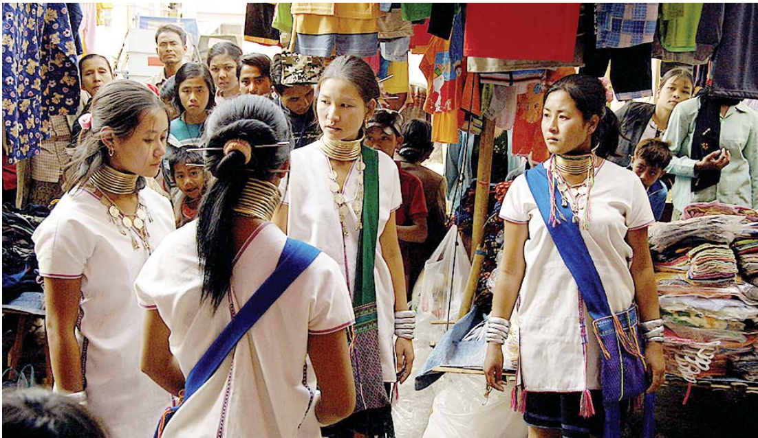
ရွှေကြက်ဖပန်းတစ်ရာရုပ်ရှင်ပွဲတော်တွင် ပြသခွင့်မရရှိခဲ့သည့် 'ကယန်းအလှ' ရုပ်ရှင်ဇာတ်ကားမှ သရုပ်ဆောင်များကို တွေ့ရစဉ်။