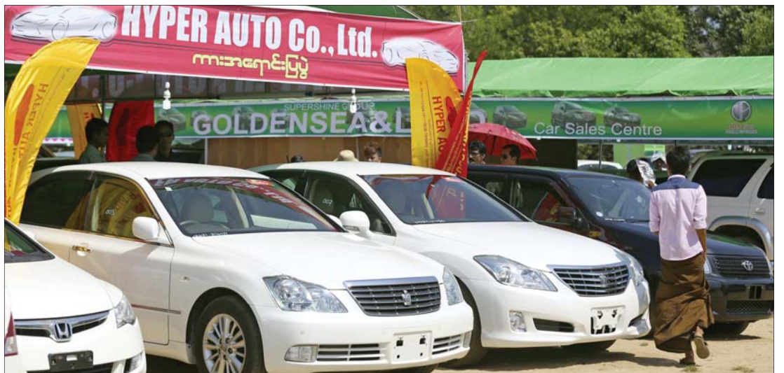
ဈေးနှုန်းကျဆင်းလျက်ရှိသော်လည်း အရောင်းအဝယ်နည်းပါးလျက်ရှိသည်။ သင်္ကြန်အပြီးကာလတွင် အရောင်းအဝယ်ကောင်းလာနိုင်သည် ဟုဆိုသည်။

ယခုအချိန်တွင် မြန်မာနိုင်ငံ၌ငွေကြေးဝန်ဆောင်မှုလုပ်ငန်းများ လုပ်ကိုင်ခွင့်ရရှိရန် နိုင်ငံတကာဘဏ်ပေါင်း ၃၅ ခန့်က စောင့်စားနေပြီး ပြင်ဆင်ရေးဆွဲနေသည့် ငွေကြေးအဖွဲ့အစည်းဆိုင်ရာ ဥပဒေအတည်ပြုပြီးပါက ပုဂ္ဂလိကငွေကြေးအားလုံး ဗဟိုဘဏ်က စီမံခန့်ခွဲသွားမည်ဟု ဆိုသည်။ ■