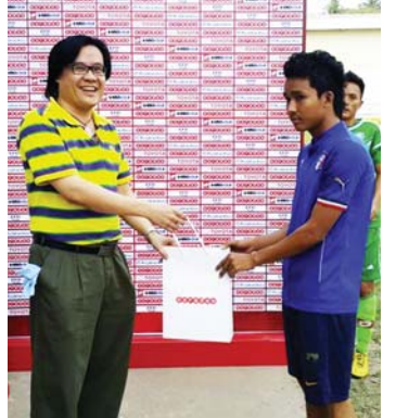
Oreedoo Cup ပြိုင်ပွဲ ပွဲစဉ်တစ်ပွဲတွင် အမှတ်တရ လက်ဆောင်ပေးနေစဉ်။

ယင်းကစားနည်းကို ပွဲစဉ်ပထမပိုင်း အပြီး၌ ပြုလုပ်ခြင်းဖြစ်ပြီး ပရိသတ်သုံးဦးသာကန်ခွင့်ရမည်ဖြစ်ကာ ဘောလုံးမှာ မြေထောက်ဘော၊ မြေလှိမ့်ဘောများဖြင့် ဂိုးဝင်ခြင်းကိုခွင့်မပြုဘဲ ဂိုးအတွင်း တိုက်ရိုက်ဝင်အောင် ကန်နိုင်မှသာ ဆုရမည် ဖြစ်သည်။ MFF Oreedo Cup ပြိုင်ပွဲပထမ အဆင့်ပွဲစဉ်များ ပြီးဆုံးပြီးနောက် ဒုတိယ အဆင့်ပွဲစဉ်များကို မေလတွင် ကျင်းပမည် ဖြစ်သည်။ ■