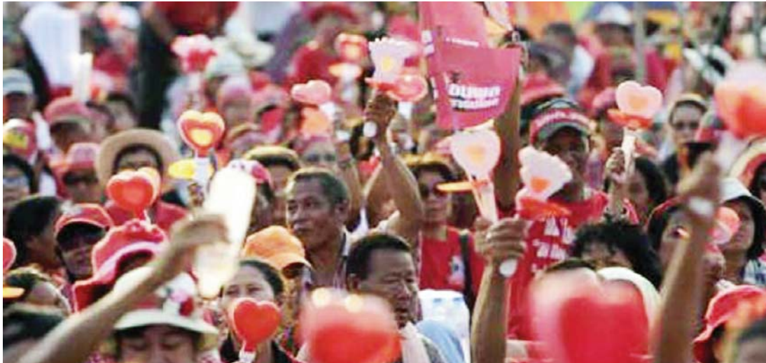
ဧပြီ ၆ ရက်က ဘန်ကောက်မြို့ အနောက်ပိုင်းတွင် ဝန်ကြီးချုပ်ယင်လင်ထောက်ခံသူများကို တွေ့ရစဉ်။

ကြားဖြတ်အစိုးရအဖွဲ့ ဝန်ကြီးချုပ် ယင်လင်၏အမှုအပေါ် လွတ်လပ်သော