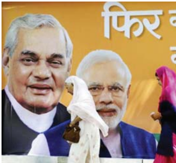
ဘီဂျေပီပါတီခေါင်းဆောင်များပုံပါသော ပိုစတာအား တွေ့ရစဉ်။

ရက်သတ္တပတ် ငါးပတ်ကြာကျင်းပမည့် ရွေးကောက်ပွဲ၌ အိန္ဒိယနိုင်ငံ၏ အစိုးရသစ် အဖြစ် ရေပန်းစားနေသော အိန္ဒိယ အဓိက အတိုက်အခံပါတီသည် ဟိန္ဒူအမျိုးသားရေး ဝါဒကို အသားပေးကာ မဲဆန္ဒရှင်များကို စည်း ရုံးသွားဖွယ်ရှိပြီး ဘာသာရေးအဓိကရုဏ်း ဖြစ်ပွားခဲ့သော နယ်မြေများကို စည်းရုံး အ သုံးချဖွယ်ရှိကြောင်း ဧပြီ ၈ ရက်က ရိုက်တာ သတင်းတစ်ရပ်တွင် ဖော်ပြထားသည်။ အတိုက်အခံပါတီတစ်ခုဖြစ်သော ဘီ ဂျေပီပါတီနှင့် ဝန်ကြီးချုပ်ဖြစ်ရန် ရေပန်းစား နေသည့် ၎င်းတို့၏ ကိုယ်စားလှယ်လောင်း မိုဒီတို့မှာ ပိုမိုကောင်းမွန်သော အစိုးရတစ်ရပ် ဖြစ်ပေါ်လာရေးနှင့် အလုပ်အကိုင် အခွင့် အလမ်းများတိုးပွားရေး၊ စီးပွားရေးဖွံ့ဖြိုး တိုးတက်မှုများကို ပြုလုပ်ပေးမည်ဟူသော ဆောင်ပုဒ်များဖြင့် စည်းရုံးနေသည်။ သို့သော်လည်း မဲပေးမှုမစတင်ခင် နာရီ ပိုင်းအလိုတွင် မိုဒီ၏ လက်ထောက်ဖြစ်သူ