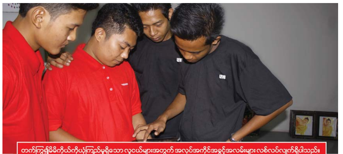
တက်ကြွ၍မိမိကိုယ်ကိုယုံကြည်မှုရှိသော လူငယ်များအတွက် အလုပ်အကိုင်အခွင့်အလမ်းများ လစ်လပ်လျက်ရှိပါသည်။

လွှတ်တော်ကို သိမ်းပိုက်ထားသော ထိုင်ဝမ်ကျောင်းသားများကို တွေ့ရစဉ်။