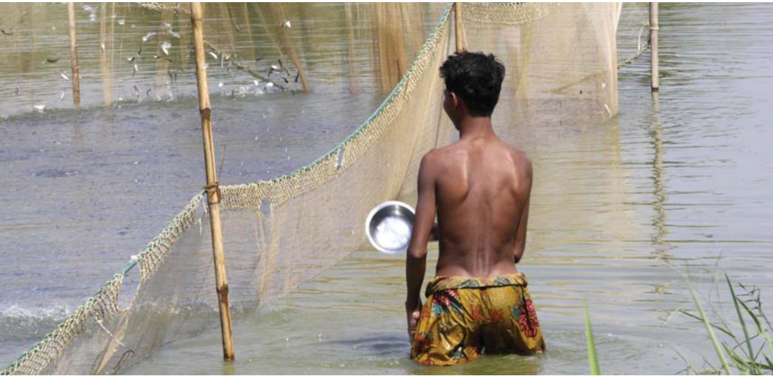
ဧရာဝတီတိုင်း ပန်းတနော်မြို့နယ်ရှိ ငါးမွေးကန်တစ်ကန်အားတွေ့ရစဉ်။

ပြည်တွင်း တိရစ္ဆာန်အစာများကို စံနှုန်းများ သတ်မှတ်ချက်များဖြင့်ထုတ်လုပ်နိုင်ရန် မြန်မာနိုင်ငံငါးလုပ်ငန်းအဖွဲ့ချုပ်နှင့်ငါး၊ ပုစွန် အစာထုတ်လုပ်တင်ပို့သူများအသင်းတို့ ဆွေးနွေးဆောင်ရွက်မှုများပြုလုပ်လျက်ရှိသည်ဟု မြန်မာနိုင်ငံ ငါးလုပ်ငန်းအဖွဲ့ချုပ်မှ ဒုတိယဥက္ကဋ္ဌ ဦးဟန်ထွန်းက ဧပြီလ ၉ ရက်တွင် မဏ္ဍိကကိုပြောသည်။ တိရစ္ဆာန်အစာများကို စံနှုန်းများ သတ်မှတ်ချက်များဖြင့်ထုတ်လုပ်နိုင်ရန် မြန်မာနိုင်ငံငါးလုပ်ငန်းအဖွဲ့ချုပ်နှင့်ငါး၊ ပုစွန်အစာထုတ်လုပ်တင်ပို့သူများအသင်းတို့၏ အလုပ်ရုံဆွေးနွေးပွဲတစ်ရပ်ကိုလည်း သင်္ကြန်မြို့ ကာလ တွင်ဆက်လက်ပြုလုပ်သွားမည်ဖြစ်ပြီး အလုပ်ရုံဆွေးနွေးပွဲမှ ရရှိလာသည့် အချက်အလက်များကို မွေးမြူရေး၊ ရေလုပ်ငန်းနှင့် ကျေးလက်ဒေသဖွံ့ဖြိုးရေးဝန်ကြီးဌာနသို့ တင်ပြသွားမည်ဖြစ်သည်ဟုလည်း ဦးဟန်ထွန်းကဆိုသည်။ လက်ရှိတွင် တိရစ္ဆာန်များစားသုံးသည့် အစာများတွင် စံနှုန်းသတ်မှတ်ထားခြင်းမရှိခြင်းများကြောင့် အရည်အသွေး ကောင်းမွန်မှုမရှိခြင်း၊ ကြီးထွားမှုနှောင့်နှေးခြင်းများနှင့် အစာအချိုးကျတွက်ချက်ခြင်းများတွင် မှန်ကန်သည့်ရလဒ်မရှိခြင်းများကြောင့် ပြည်ပနိုင်ငံများနှင့်နှိုင်းယှဉ်ပါ