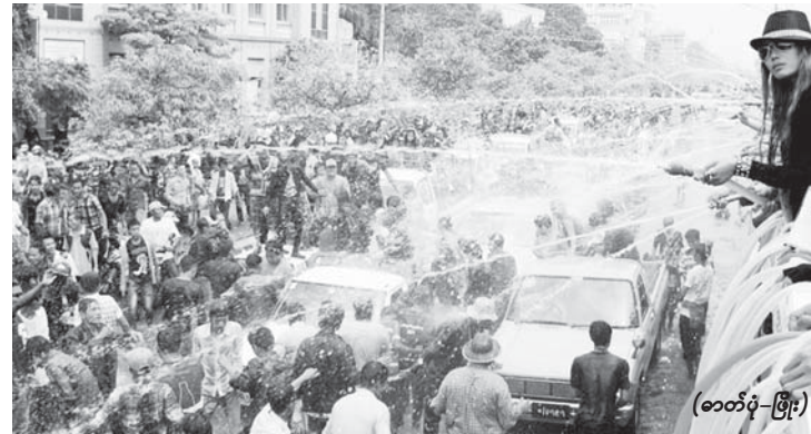
အများပြည်သူစိတ်အနှောင့်အယှက်ဖြစ်စေမည့် ယာဉ်များကို အရေးယူသွားမည်။

သင်္ကြန်မတိုင်မီကာလတွင် ကျုံးဘေးပတ်လည်မှ ရေကစားမဏ္ဍပ်များ၏ ယာဉ်များ စည်းကမ်းမဲ့ရပ်နားထားခြင်း၊ ယာဉ်နှစ်ထပ်ရပ်တန့်ခြင်းနှင့် မဏ္ဍပ်ကြော်ငြာလက်ကမ်းစာစောင်များ ဝေရာတွင် လမ်းသွားလမ်းလာများ အနှောင့်အယှက်ဖြစ်ပါက ယာဉ်ထိန်းရဲတပ်ဖွဲ့များက ရွေ့လျားစနစ်များဖြင့် လှည့်လည်စစ်ဆေးကာ သတိပေး ဆောင်ရွက်သွားမည်ဖြစ်သည်ဟု သိရသည်။ ■