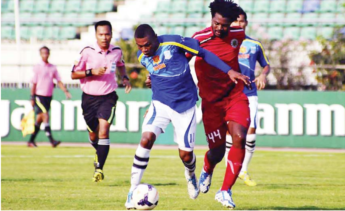
မြန်မာနေရှင်နယ်လိဂ်ပွဲစဉ်တစ်ပွဲဖြစ်သည့် ရတနာပုံနှင့် မနောမြေပွဲတွင် နှစ်ဖက်အသင်းမှ နိုင်ငံခြားသားကစားသမားများ အကြိတ်အနယ်ကစားနေစဉ်။