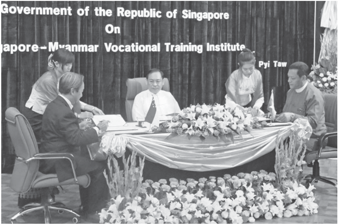
စင်ကာပူ- မြန်မာ အသက်မွေးဝမ်းကျောင်းဆိုင်ရာ သင်တန်းကျောင်းတစ်ခုကို ရန်ကုန်မြို့တွင် ၂၀၁၅ ခုနှစ်ခန့်တွင် ဖွင့်လှစ်သွားရန် နားလည်မှုစာချွန်လွှာ လက်မှတ်ရေးထိုးနေစဉ်။

မြန်မာနိုင်ငံတွင် HIV ဝေဒနာခံစား နေရသူ ၂၄၀,၀၀၀ ဦးကျော်ရှိကာ ကလေး ငယ်များ HIV ဝေဒနာခံစားနေရခြင်းမှာ မိခင်ထံမှ ကူးစက်ခြင်းခံရခြင်းဖြစ်ကြောင်း ၎င်းက ဆက်ပြောသည်။ ■