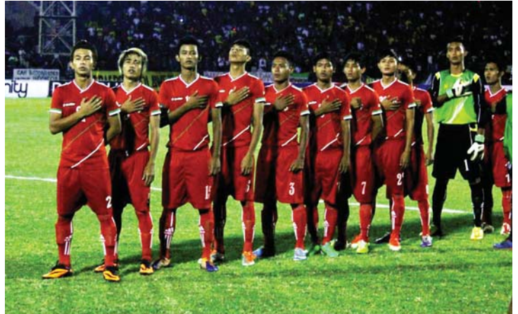
ဥရောပခြေစမ်းခရီးသွားမည့် မြန်မာယူ-၁၉ အသင်း။

မြန်မာယူ-၁၉အသင်းအနေဖြင့် ဧပြီ ၁၀ ရက်တွင် ဂျာမနီယူ-၁၉ အသင်းနှင့် မြန်မာနိုင်ငံ၌ ခြေစမ်းပွဲကစားမည်ဖြစ်ပြီး မေလအတွင်း အင်ဒိုနီးရှားနိုင်ငံသို့ သွားရောက်ကာ ခြေစမ်းပွဲသုံးပွဲကစားရန် စီစဉ်ထားသည်။ ထို့အပြင် ဇူလိုင်လတွင် ဥရောပခရီးစဉ်အဖြစ် အင်္ဂလန်၊ ဂျာမနီ၊ ဆလိုဗက်ကီးယားနိုင်ငံများသို့ သွားရောက်မည်ဖြစ်ပြီး ဘရူနိုင်းဖိတ်ခေါ်ပြိုင်ပွဲသို့လည်း ဝင်ရောက်ယှဉ်ပြိုင်ရန် ရှိနေသည်။ “ကျွန်တော်တို့အသင်း