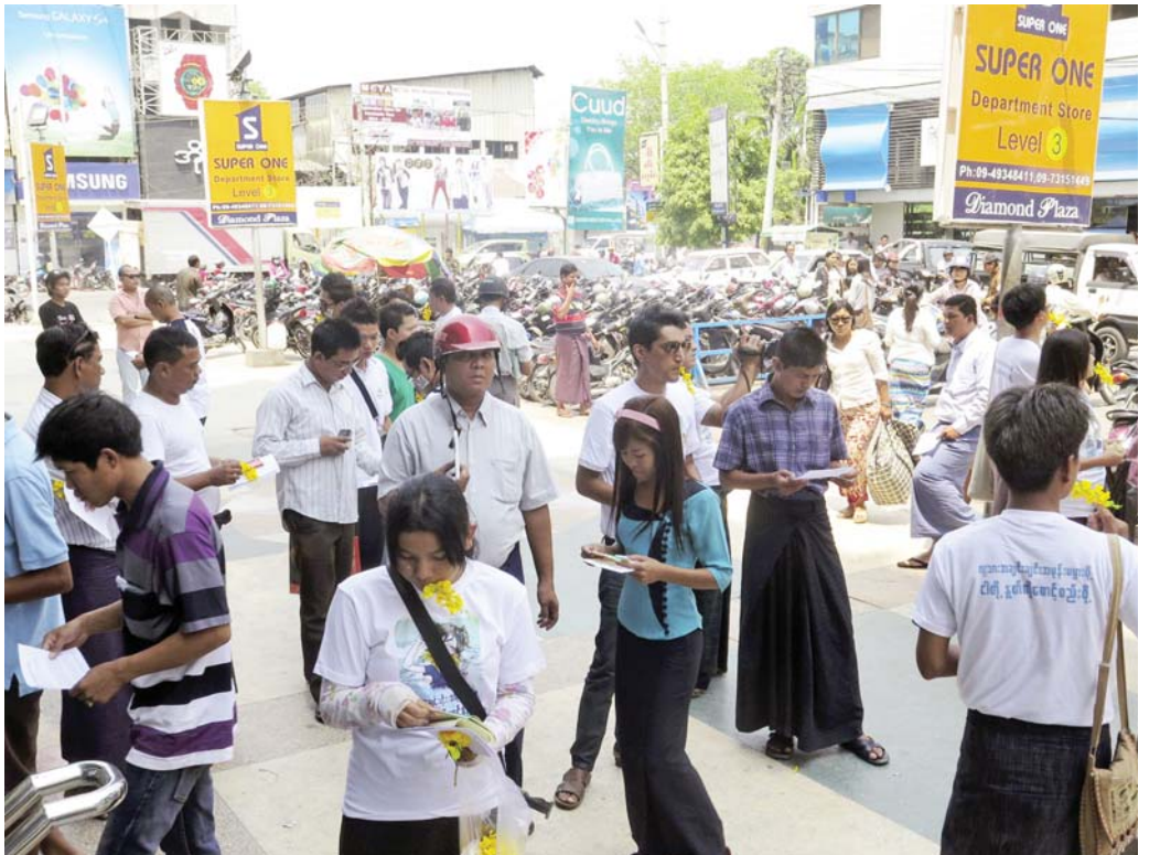
ပန်းစကားလှုပ်ရှားမှုကို မန္တလေးမြို့ ခိုင်းမွန်းပလာဇာရှေ့တွင် ပြုလုပ်နေစဉ်။

လှုပ်ရှားမှုများကို လစဉ်လုပ်ဆောင်သွားမည်ဖြစ်ကာ မည်သူမဆိုပါဝင်နိုင်မည်ဖြစ်ပြီး ပါဝင်လိုသူများအတွက် ပန်းစကား လှုပ်ရှားဆောင်ရွက်မှုများကို ဖော်ပြမည့် www.facebook.com/panzagar page တစ်ခုကို ဖွင့်လှစ်ထား