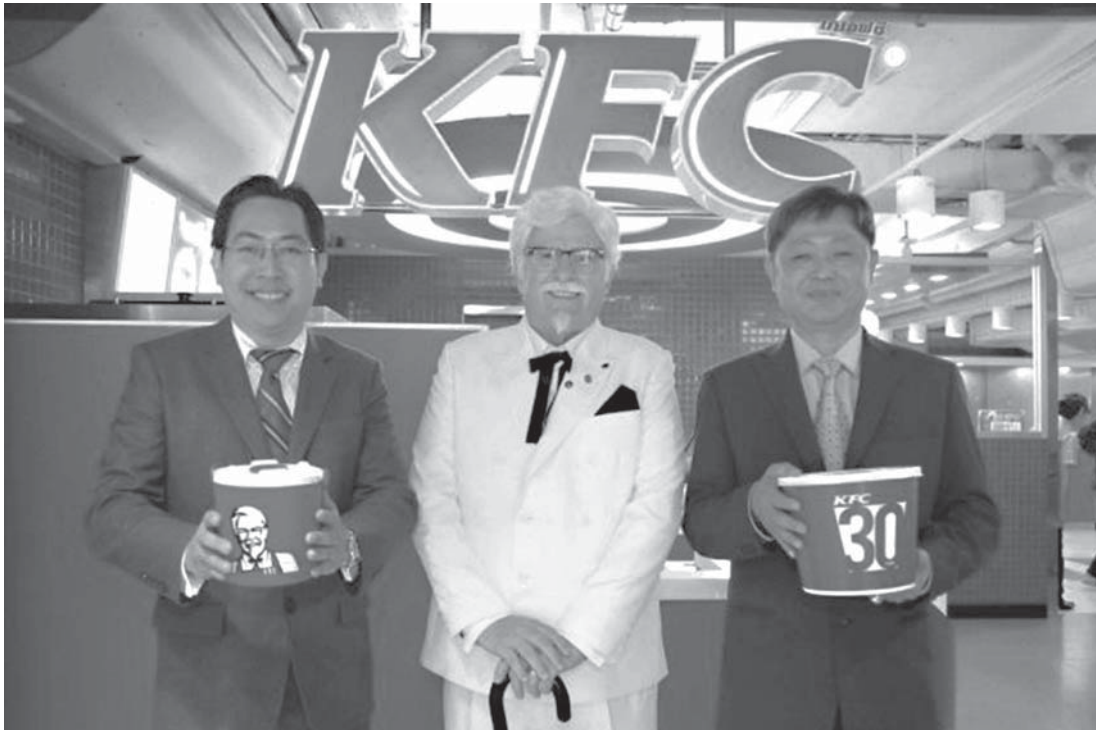
KFC စားသောက်ဆိုင်သစ် ၅၀ ထက်မနည်းကို ယခုနှစ်အတွင်း ဖွင့်လှစ်သွားမှာဖြစ်သည်။

တရုတ်နိုင်ငံတွင် Yum Restaurants ပိုင်လည်ပတ်လုပ်ကိုင်နေသော ဆိုင်