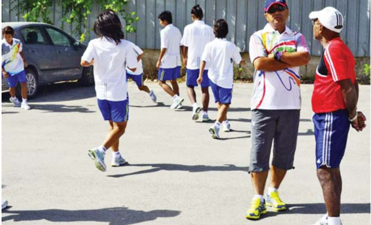
အာရှအမျိုးသမီးခြေစစ်ပွဲကို ပါလက်စတိုင်းနိုင်ငံတွင် သွားကစားစဉ်က လေ့ကျင့်မှုများပြုလုပ်နေသော မြန်မာအမျိုးသမီးအသင်း။

မြန်မာအမျိုးသမီးလက်ရွေးစင်အသင်းအနေဖြင့်ဗီယက်နမ်အသင်းနှင့် ခြေစမ်းပွဲကစားရန် စီစဉ်ခဲ့သော်လည်း ဖျက်ပြယ်ခဲ့