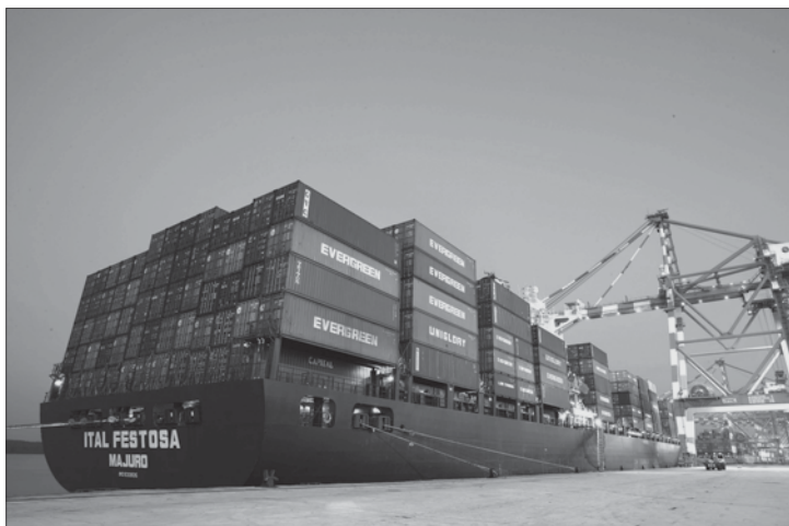
စင်ကာပူနိုင်ငံအနေဖြင့် ရေကြောင်းမှ တစ်ဆင့် တရုတ်နိုင်ငံသို့ ကုန်ပစ္စည်းတင်ပို့မှု ပမာဏမှာ တိုးမြှင့်လာနိုင်ဖွယ်ရှိသည်။

စွမ်းအင်ထောက်ပံ့မှုနှင့် ကုန်သွယ်မှု ကုမ္ပဏီ၏ အကြီးအကဲလည်းဖြစ်သူ