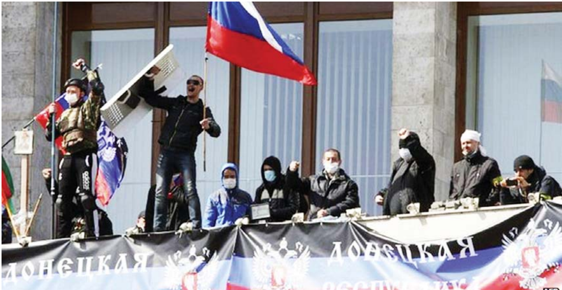
ဧပြီ ၇ ရက်က ရုရှလိုလားသူများ ယူကရိန်းအစိုးရ အဆောက်အအုံတစ်ခုကို သိမ်းပိုက်ကာ အောင်ပွဲခံနေစဉ်။